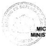
MICHELLE BACHELET JERIA MINISTRA DE DEFENSA NACIONAL